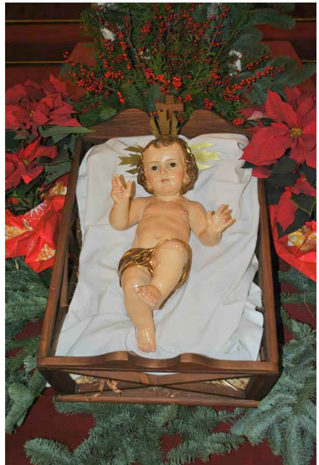
Niño Jesús con su cuna de la Parroquia de San Roque