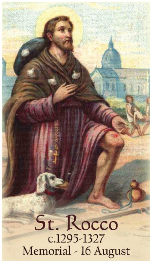
Estampa de San Roque. Italia