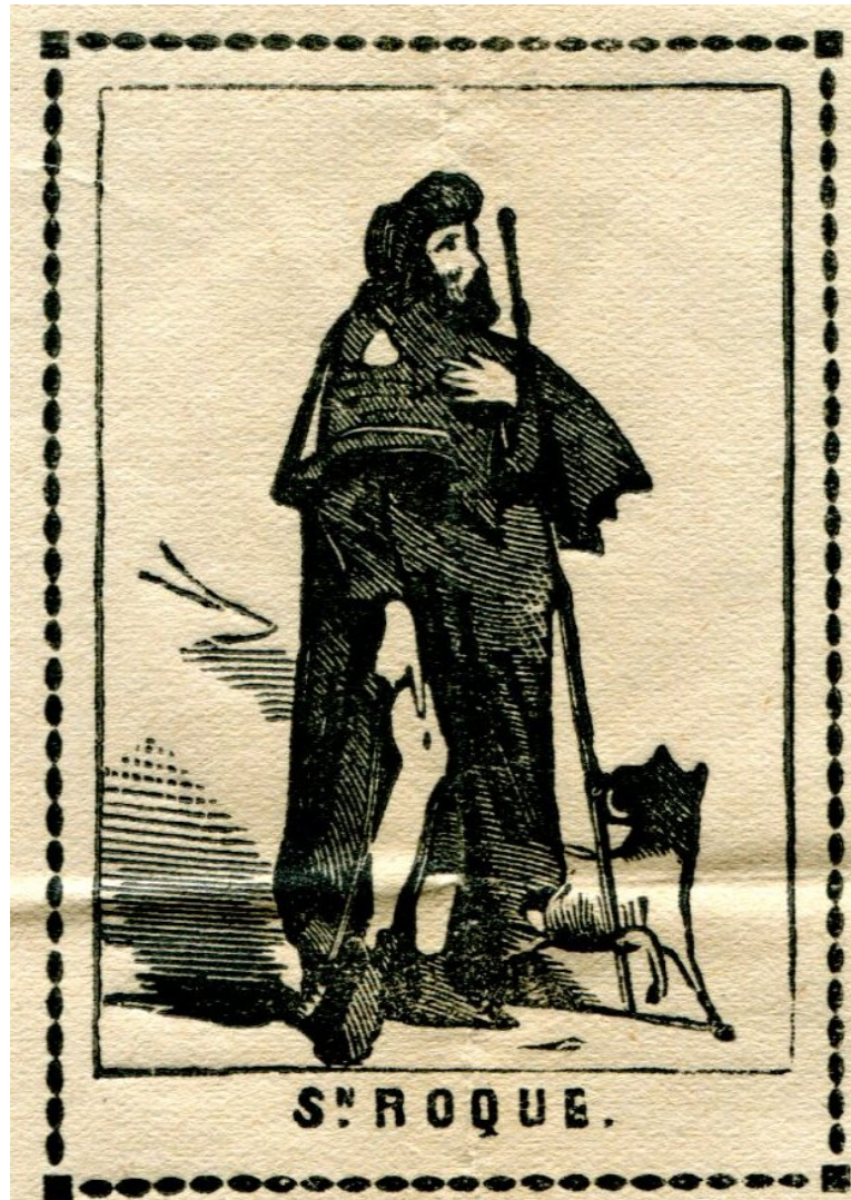
Litografía de San Roque, Patrón de Alcoy, abogado contra la peste. Siglo XIX En Archivo Parroquial. Negativo en madera de Boj