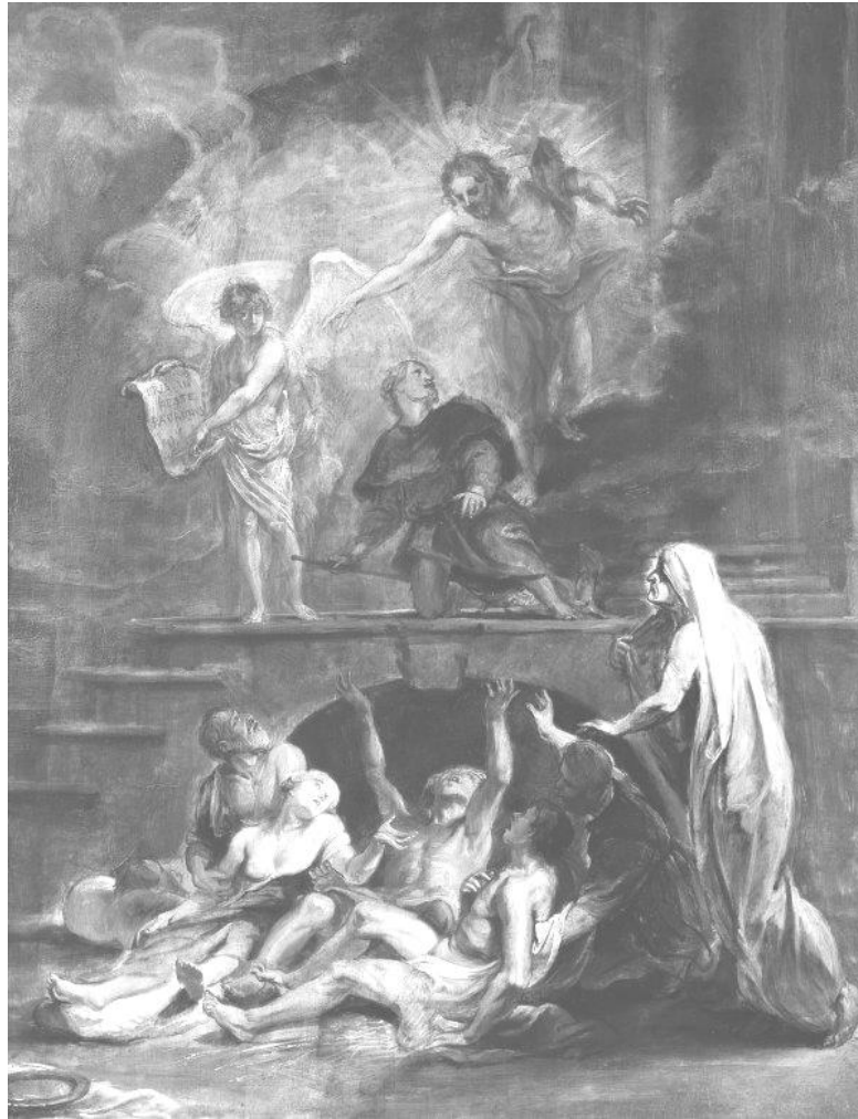
San Roque Patrón contra las epidemias.

Rubens. Año 1623 Colección Thyssen Bornemisza.