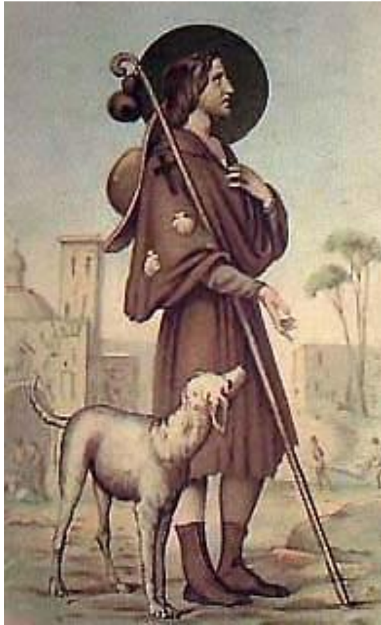
Estampa de San Roque procedente de Inglaterra guardada en Archivo Parroquial