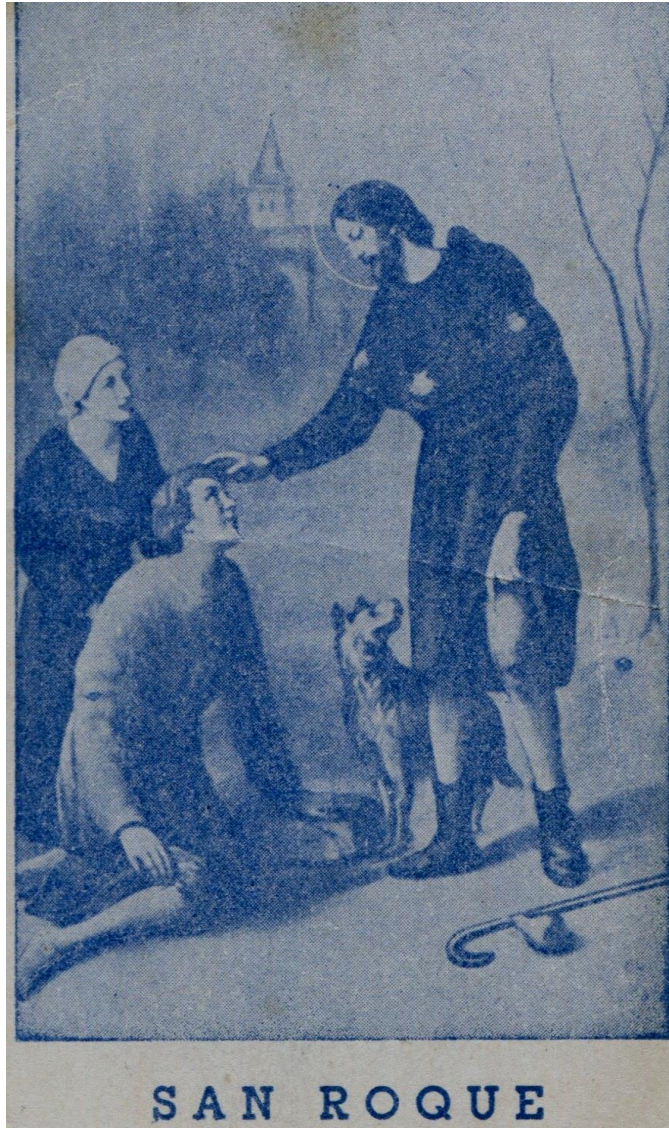
San Roque. Estampa en Archivo Parroquial