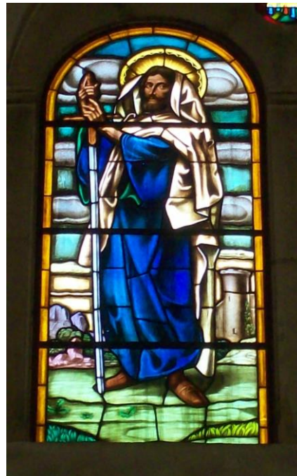
Cuadro de Segrelles representando a San Pablo convertido en vidriera

Ambas vidrieras en el cimborrio del Altar Mayor de San Roque