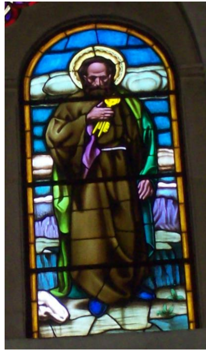
Cuadro de Segrelles representando a San Pedro convertido en vidriera